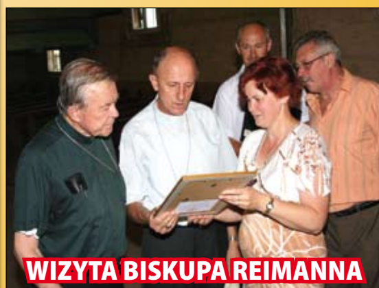
WIZYTA BISKUPA REIMANNA