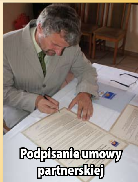
Podpisanie umowy partnerskiej