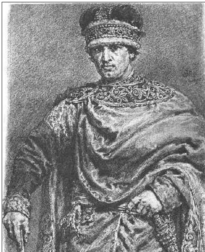
Władysław II Wygnaniec

kolejnej wyprawy niemieckiej na Polskę w celu przywrócenia mu władzy. Na czele tej wyprawy stanął cesarz niemiecki Fryderyk I Barbarossa. Bolesław Kędzierzawy złożył cesarzowi hołd lenny w Krzyszkowie, zapłacił ogromny okup i uzyskał potwierdzenie swych praw jako zwierzchnika dzielnic.