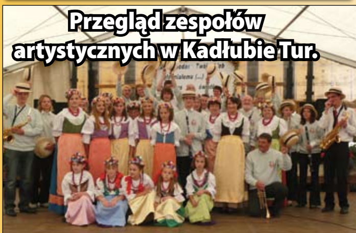
Przeгляд zespołów artystycznych w Kadłubie Tur.