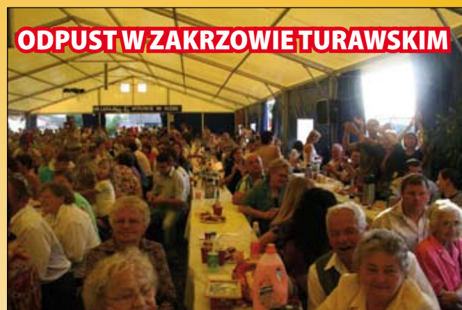
ODPUST W ZAKRZOWIE TURAWSKIM