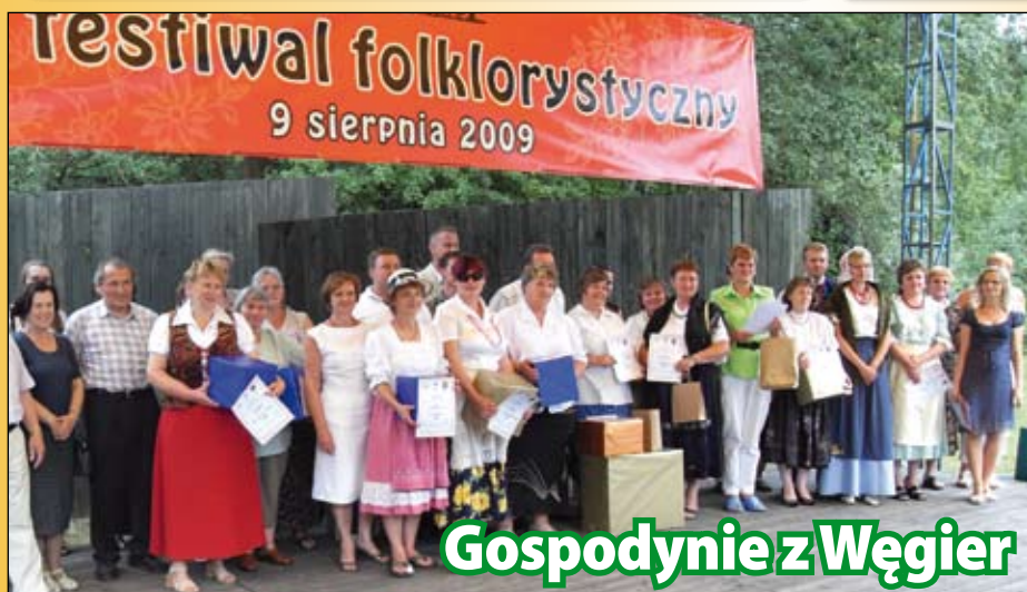
Gospodynie z Węgier