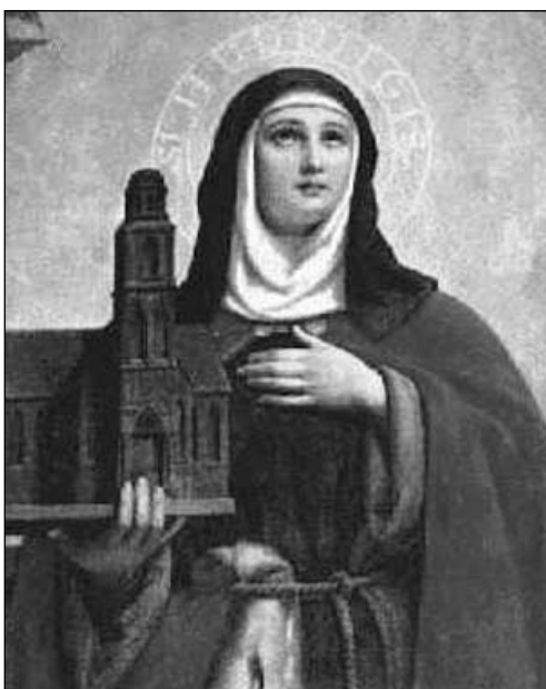
Św. Jadwiga śląska

Rządy w Polsce objęli Bolesław Kędzierzawy i Mieszko Stary. Przebywający na wygnaniu Władysław doprowadził w 1157 r. do