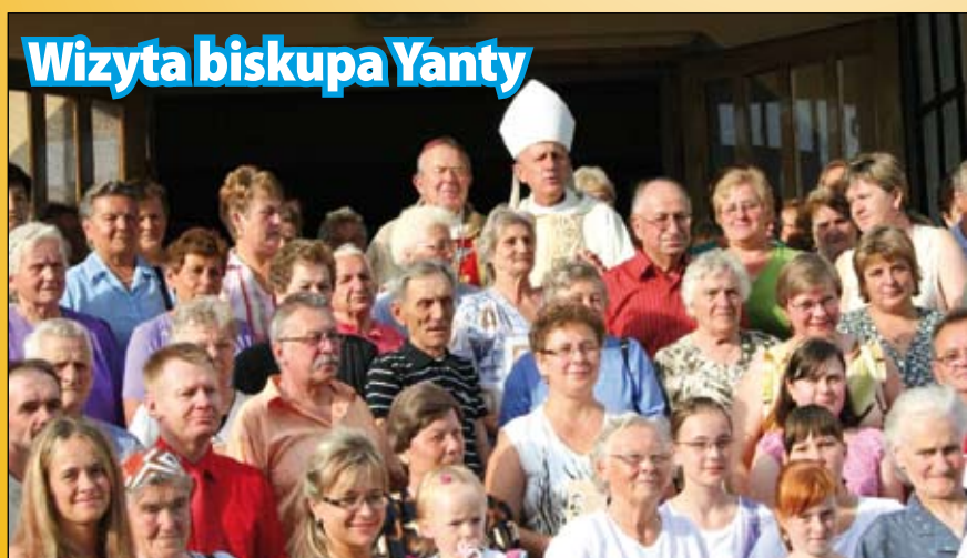
Wizyta biskupa Yanty