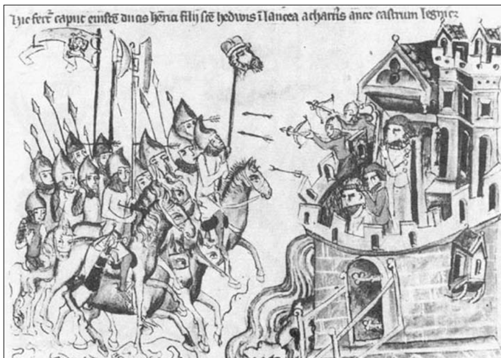
Bitwa pod Legnicą

Książę wrocławski Henryk I Brodaty chciał zjednoczyć Polskę, zdobył nawet w 1232 r. Kraków. Stał się najpotężniejszym z książąt piastowskich. Dzieło to kontynuował jego syn Henryk II Pobożny. Stworzyli państwo Henryków Śląskich, w skład którego wchodziła ziemia krakowska, sandomierska, Śląsk i południowa Wielkopolska. Kres jego panowaniu położył w 1241r. najazd Tatarów. 1 kwietnia 1241r. połączone siły mongolskie opuściły Kraków i ruszyły w kierunku Raciborza. Grodu tego jednak nie zdobyli, bo był dobrze przygotowany do obrony. Wzdłuż Odry ruszyli w kierunku Opolą. Doszło do bitwy, rycerstwo księcia opolskiego Władysława wobec przewagi nieprzyjaciela wycofało się w kierunku Wrocławia. Siły mongolskie po zwycięskiej potyczce przez nikogo nie niepokojone podążyły za oddziałami opolskimi. Miasto Wrocław zostało wcześniej ewakuowane i podpalone, a gród był przygotowany do obrony. Mongołowie nie próbowali zdobyć