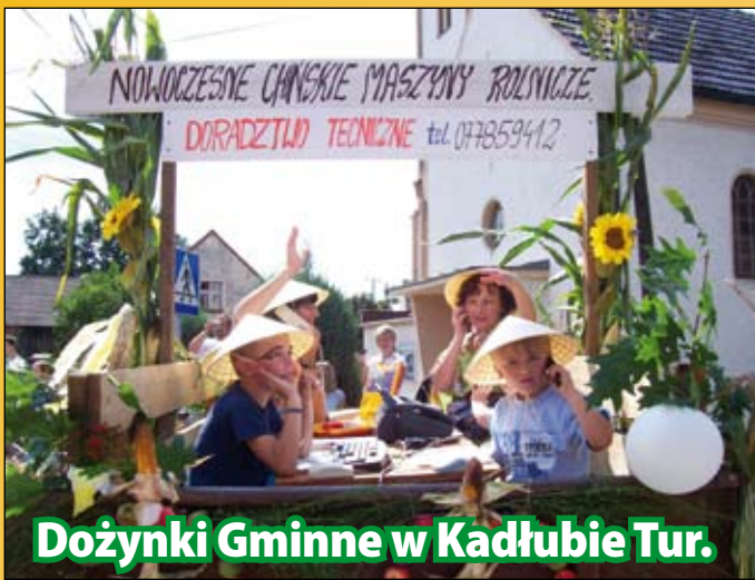
Dożynki Gminne w Kadłubie Tur.