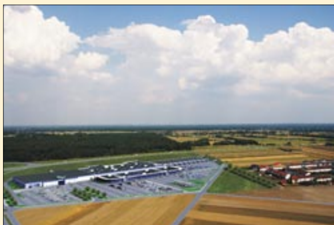
Walka o inwestora dobiega końca.