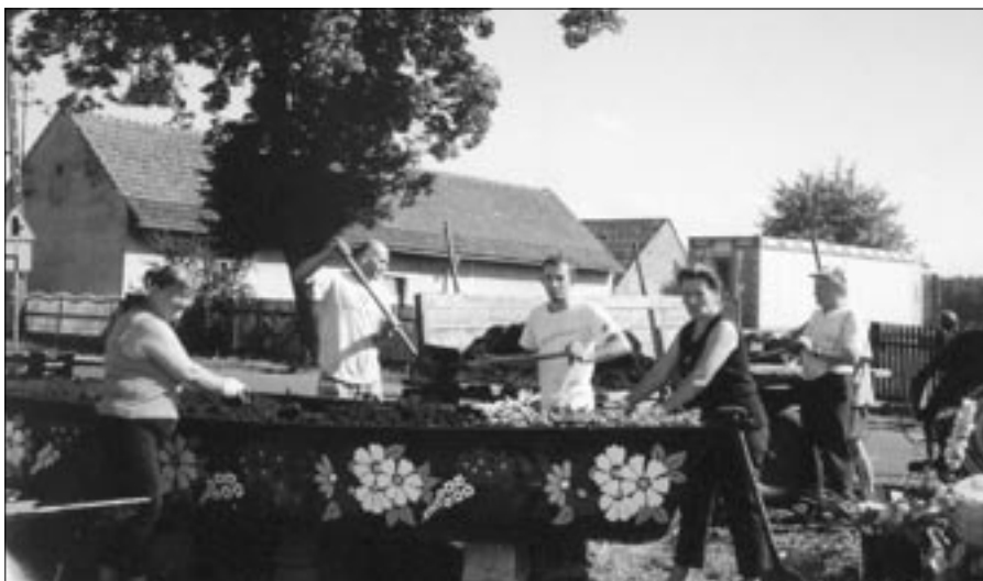
W trakcie prac.