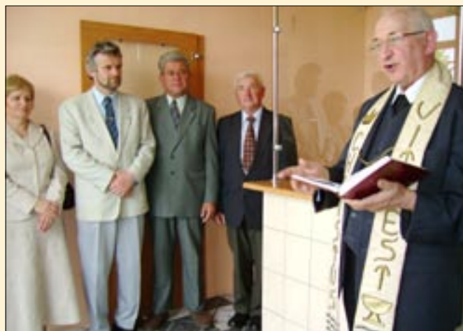
Nowa placówka Banku Spółdzielczego w Łubnianach.