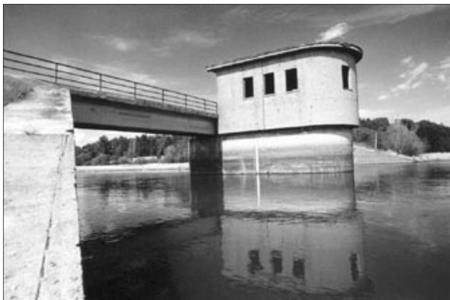
2. Wpływ Małej Panwi do Jeziora.

Według tego najnowszego projektu odstąpiono od planów, aby jezioro sięgało dalej na wchód w stronę Starej Schodni i Pustkowa. Przeważały względy ekonomiczne i higieniczno-sanitarne. Wykup tych terenów rolniczo użytkowanych byłby droższy od zysków z ich zalania. Teren ten bowiem jest w większości tylko 1m poniżej poziomu normalnego piętrzenia tj. 176,10 m n.p.m. i ilość piętrzonej tutaj wody nie równoważy kosztów jej pozyskania. Dlatego zdecydowano się na ściśnięcie – zmniejszenie jeziora przez nałożenie mu jakby gorsetu w postaci wałów bocznych Szczedrzyk – Jedlice długości 3300 m i Jedlice – Dylaki długości 1400 m oraz wybudowanie zbiornika wstępnego. Wał czołowy tego zbiornika długości 700 m łączy w/w wały. Wały boczne zbiornika wstępnego