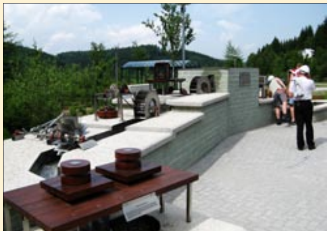
Wizyta strażaków w partnerskiej gminie Saalfelder Höhe.