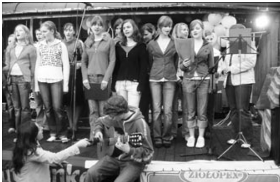
Wielka Majówka w Domu Dziecka w Turawie.

Młodzieżowa Rada Gminy Turawa II kadencji (2006 – 2008) rozpoczęła swoją działalność sesją inauguracyjną 17 grudnia 2006 roku. Realne prace młodzież rozpoczęła z początkiem stycznia 2007. Dziś mija 8 miesięcy działania Młodzieżowej Rady Gminy Turawa II kadencji. Radę tą tworzą osoby, które były członkami Młodzieżowej Rady Gminy Turawa I kadencji oraz nowi radni. Radni reprezentują miejscowości – Kotórz Wielki, Kotórz Mały, Rzędów, Węgry, Zawadę, Turawę, Zakrzów Turawski oraz Ligota Turawska, co daje łącznie reprezentację 8 miejscowości. Brakuje nam jednak jeszcze radnych z Osowca, Bierdzan i Kadłuba Turawskiego, mimo jednak tego w porównaniu z pierwszą kadencją obecna MRGT jest już radą bardzo reprezentatywną.