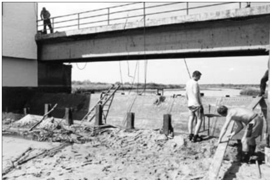
4. Remont jazu kłapowego przy ujściu Małej Panwi do Jeziora.

ALFRED KUPKA O NASZYCH STAUBECKACH ODCINEK VII