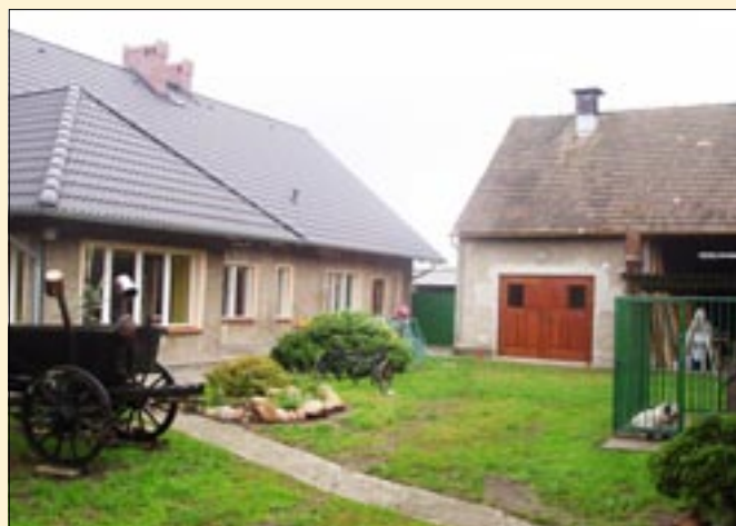
Zagroda państwa Ebisch – III miejsce w województwie w konkursie „Piękna wieś opolska”.