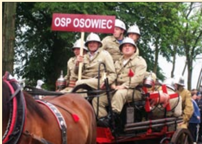
Z życia OSP Osowiec.