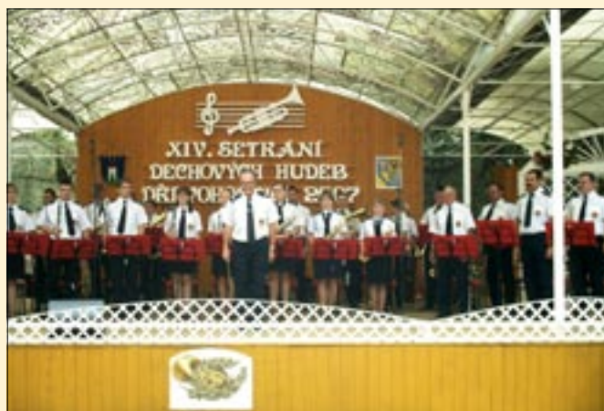
Muzyczne wieści z Węgier.