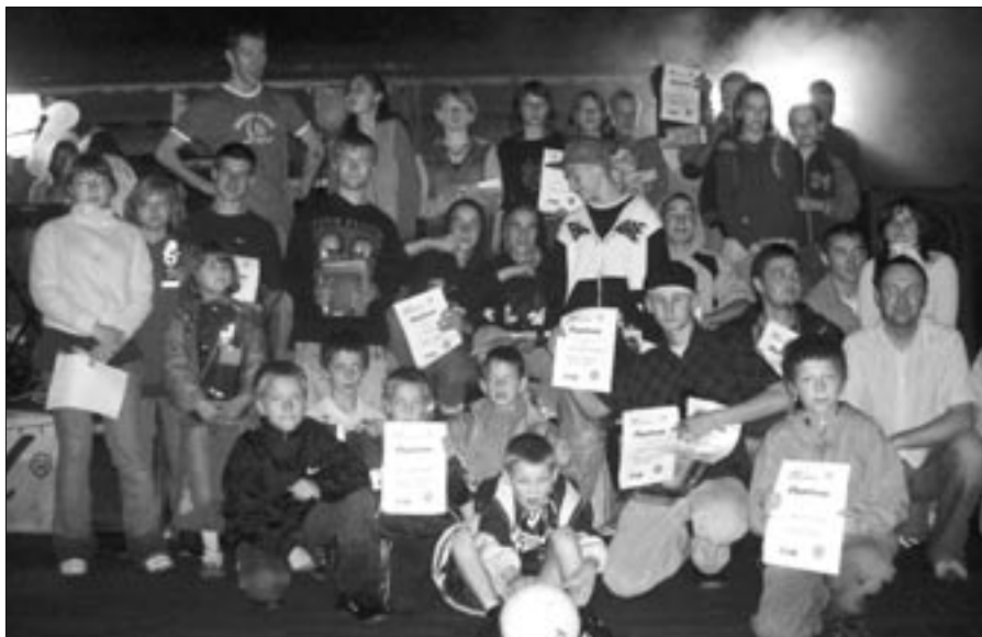
Wielka Majówka w Domu Dziecka w Turawie.

Innymi inicjatywami, jakie chcemy zrealizować, są nawiązanie współpracy z nowo wybraną Młodzieżową Radą Miasta Opola