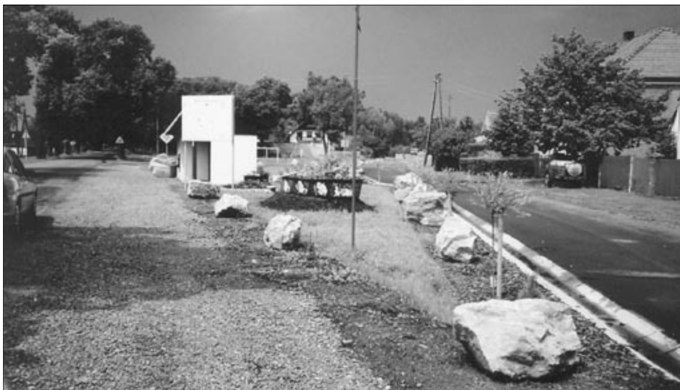
Plac po zakończeniu.