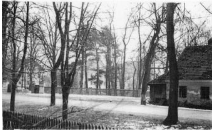
Kuźnia pańska przypałacowa.