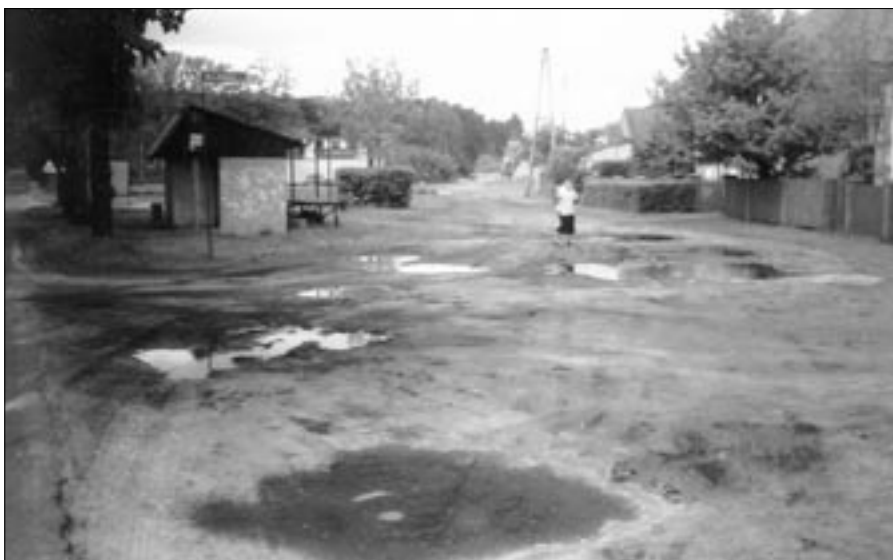
Plac przed pracami.