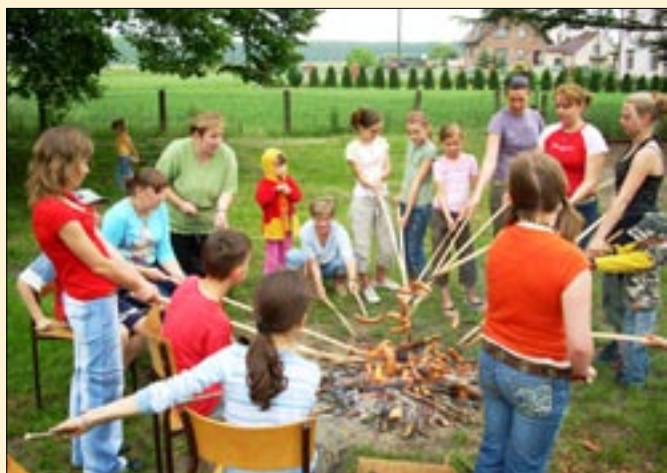
Pół roku minęło... – Dzień dziecka w Kotorzu Małym.