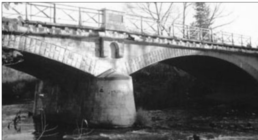
Most na Małej Panwi po odbudowie (widok obecny).

domiono komendanturę wojskową, że grasują w Trzęsinie szabrownicy. Komendant rosyjski na motocyklu dogonił pociąg i zatrzymał lokomotywę. Zabrał polskim szabrownikom skradziony pas transmisyjny. Komendant zaproponował im, żeby przyjechali tydzień później, bo będzie to niedziela palmowa i wielu mieszkańców Trzęsiny pójdzie do kościoła. Wtedy będą się mogli obłowić. Od tego czasu został utworzony w przy młynie drugi posterunek z dwóch żołnierzy rosyjskich. Faktycznie po tygodniu szabrownicy przyjechali, a mieszkańcy Trzęsiny byli w kościele. Gdy żołnierze rosyjscy pilnujący młyn zobaczyli Polaków rabujących domy w Trzęsinie, wystrzelili czerwoną raketę. Przyjechali żołnierze rosyjscy z Osowca. Aresztowali polskich szabrowników i odstawili ich do Opolu. Jeszcze długi czas lokomotywa z wagonami stała na torach przy Trzęsinie. Wydaje mi się, że Rosjanie chcieli uchronić naszą wioskę”.