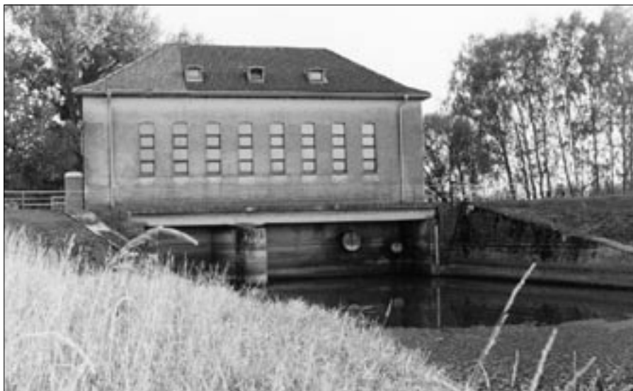
3. Przepompownia w Jedlicach – niedoszła elektrownia (widok od strony Jeziora).

Zbiornik ten usytuowany na wlocie rzeki Mała Panew do Jeziora Dużego ma 0,6 km 2 powierzchni i mieści 634 tys. m 3 wody. Od zbiornika głównego oddzielony jest wałem długości ok. 700 m, który w kierunku na północ przechodzi w wał boczny Jedlice – Dylaki, a od południa w wał boczny Jedlice – Szczedrzyk. W korycie rzeki wbudowany jest jaz kłapowy uchylny, dwuprzęsłowy. Wysokość kłap pierwotnie założono 2,5 m, a szerokość przeszła