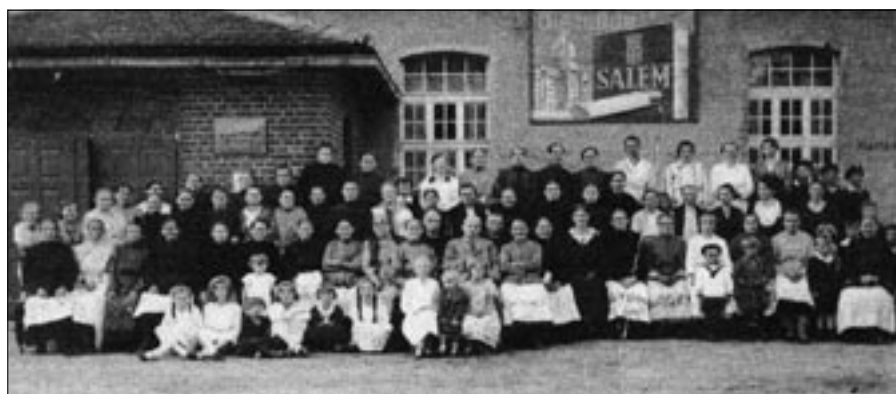
Frauenschaft (spotkanie gospodyń) w Sali „U Michla” w Kadłubie Turawskim.

syjska, na czele stało dwóch oficerów. Miałem szczęście, że skierowano mnie do kierownika warsztatu elektrycznego, byłem przyjęty jako 18. pracownik. Zakład