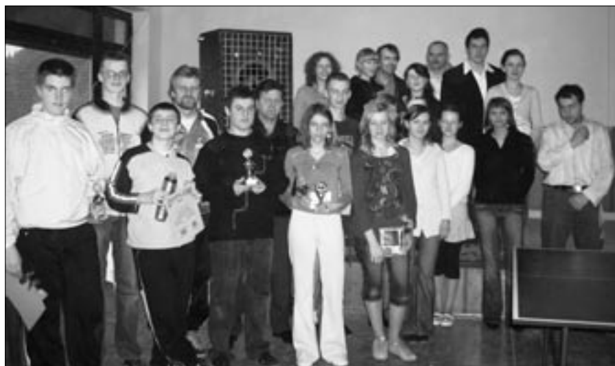
Turniej Tenisa Stołowego – Pożegnanie zimy 2007.