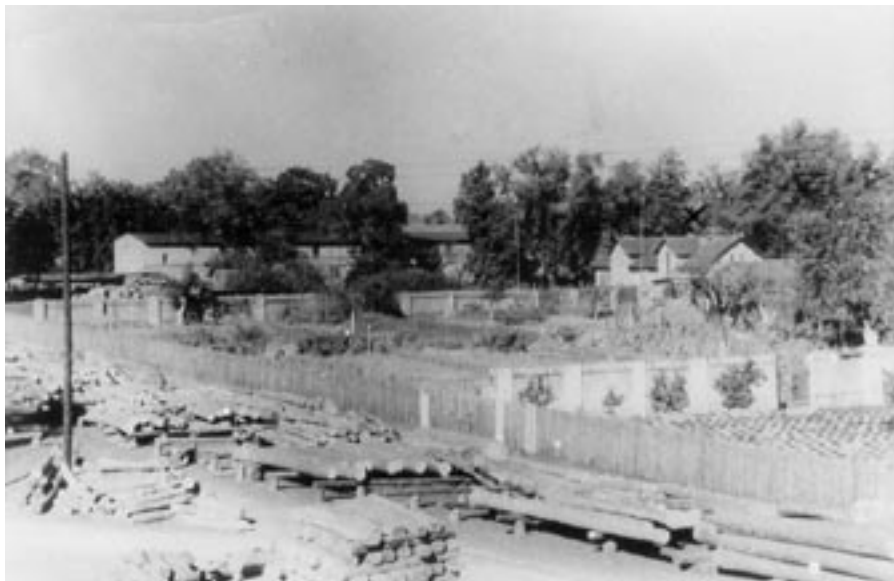
Dom tartaczny przy ulicy Ogrodowej 6.