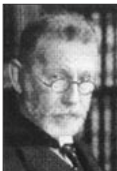
1908 – Paul Ehrlich Nagroda Nobla w dziedzinie medycyny