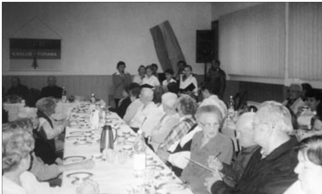
Czas na zabawę.

Po zmianie ustroju politycznego w 1989 roku zaczęły się tworzyć struktury mniejszości narodowej w Kadłubie Turawskim. Lokalny zarząd ukonstytuował się 15 maja 1990 roku w składzie: