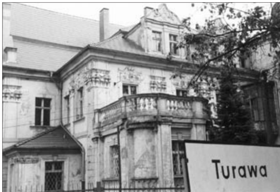
Pałac – stan elewacji od strony południowej.