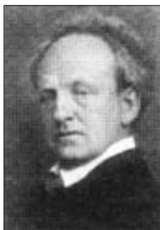
1912 – Gerhart Hauptmann Nagroda Nobla w dziedzinie literatury

Po 1901 r. Hauptmann powrócił na rodzinny Śląsk, zamieszkał w Jagniątkowie i pozostał tam aż do śmierci w dniu 6 czerwca 1946 r. Spoczął na cmentarzu klasztornym na wyspie Hiddensee. Podkreślenia wymaga fakt, że radziecka komendantura wojskowa sprawująca w tym czasie władzę na tym terenie, nie uczyniła przeszkód, a nawet udzieliła pomocy w przetransportowaniu zwłok pisarza na miejsce wiecznego spoczynku. Gerhart Hauptmann jest jak dotąd jedynym śląskim laureatem Nagrody Nobla w dziedzinie literatury.