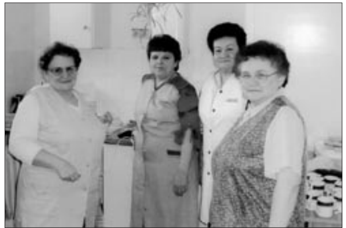
Panie dbające o dobry poczęstunek.