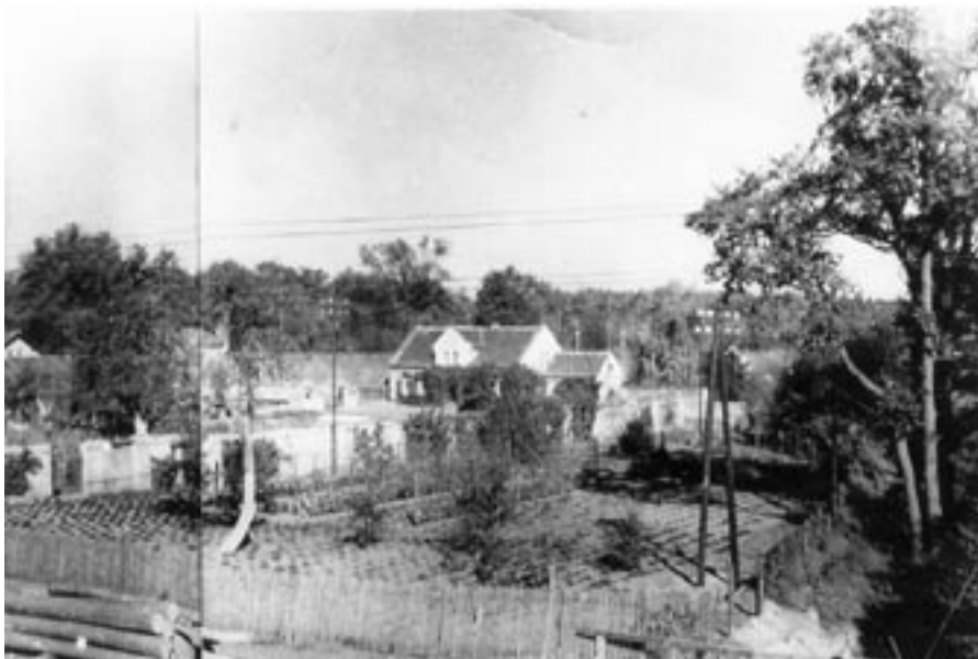
Domek ogrodnika – 1872 r.