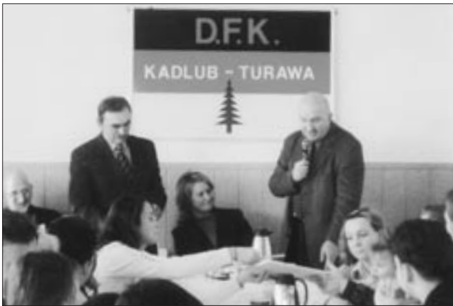
Uroczyste otwarcie nowo wyremontowanej sali.