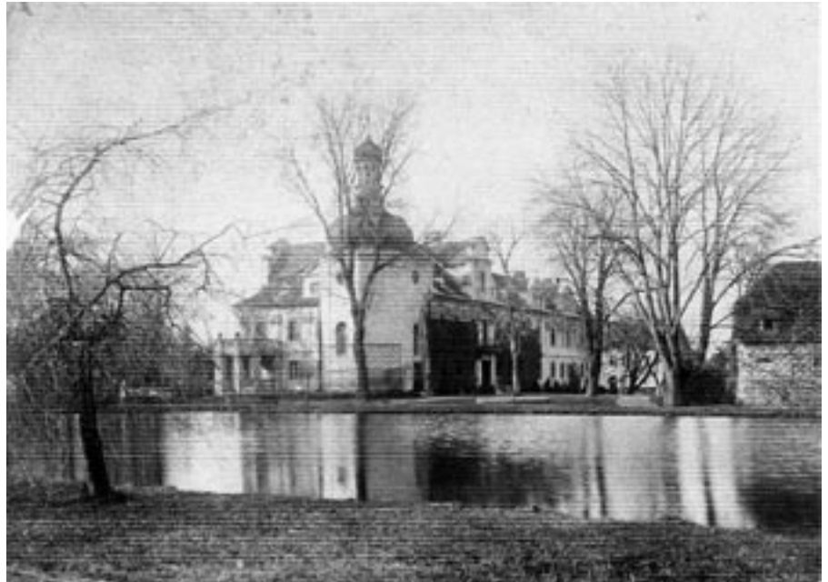
Część zachodniego skrzydła Beamtenhausu.

dzi innymi i piszący te słowa. Był po prostu piękny i pedantycznie zadbane. Karl zajął się budownictwem, rolnictwem i gospodarką leśną. To za jego czasów w Turawskich dobrach