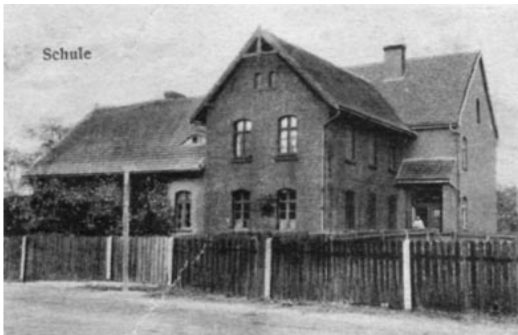
Szkoła w Kadłubie Turawskim – zdjęcie wykonane w latach dwudziestych XX w.