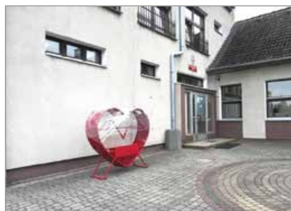
Zawada, obok szkoły podstawowej przy ul. Kolanowskiej