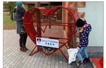
Rzędów, obok Jednostki Strażackiej przy ul. Opolskiej