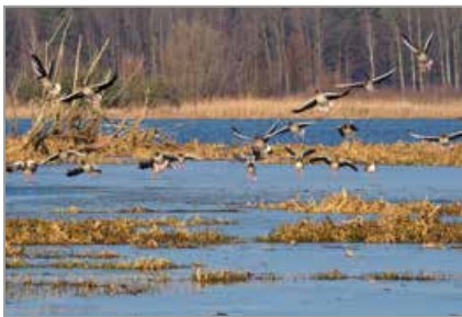
Ptaki – gęś gęgawa (Turawa)