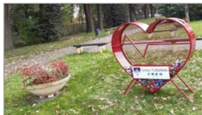
Turawa – rondo przy ul. Opolskiej