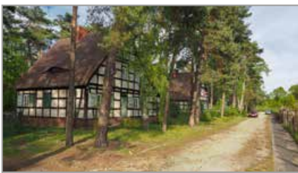
Jezioro Turawskie Duże, brzeg zachodni – Rybaczówka

pokonać dość ruchliwą drogą gminną. Na końcu wału trasa naszej wycieczki skręca w lewo i wjeżdża do lasu. Po chwili mijamy Jezioro Średnie, a po lewej mamy południowy brzeg Jeziora Dużego. Jadąc wzdłuż brzegu tego drugiego, kawałek za Jeziorem Średnim mijamy ukryte w lesie Jezioro Małe. Tuż za nim kończy się asfaltowa droga, a my skręcamy w prawo, w leśną ścieżkę. Okrążamy lasem Jezioro Małe i na pierwszym rozwidleniu skręcamy w lewo. Jedziemy ok. 300 m krętą i wąską leśną ścieżką, za którą dojeżdżamy do asfaltowej drogi obok niewielkiego zakładu karnego, gdzie skręcamy w prawo. Na następnym rozwidleniu skręcamy w lewo i podjeżdżamy lekko pod górę drogą z betonowych płyt. Mijamy park linowy z prawej strony i Ośrodek Wypoczynkowy Jowisz z lewej i skręcamy w prawo. Jedziemy prosto drogą pomiędzy domkami letniskowymi. Niecały kilometr dalej wyjeżdżamy z lasu i docieramy do pierwszych zabudowań Szczedrzyka. Tutaj opuszczamy na chwilę zielony szlak biegnący przez centrum