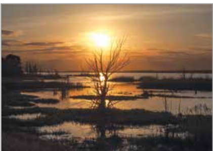
Jezioro Turawskie Duże – brzeg południowy