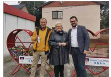
Osowiec, obok piekarni przy ul. Oleskiej, Trzęsina – ul. Młyńska obok kapliczki