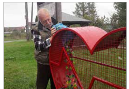
Zakrzów Turawski, plac obok Stawu przy ul. Kościelnej