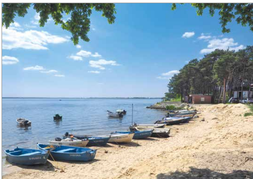
Jezioro Turawskie Duże – brzeg północny

do jeziora. Jadąc cały czas prosto czerwonym szlakiem rowerowym, mijamy po prawej stronie piękne łąki na skraju Dylaków i tuż za nimi skręcamy w lewo i wjeżdżamy w głąb lasu. Jedziemy ok. 1 km, pokonując dwa zakręty w prawo i podjeżdżając pod niewielką górkę, dojeżdżamy do skrzyżowania z asfaltową drogą, na którym skręcamy w lewo. Po chwili na rozwidleniu skręcamy w prawo, omijając główną drogę pomiędzy ośrodkami wypoczynkowymi i domkami letniskowymi. Dalej droga meandruje po mniej zabudowanych terenach i dociera do głównej promenady spacerowej nad Jeziorem Dużym. Czerwony szlak rowerowy na jej początku skręca w prawo i od razu w lewo, prowadząc mniej zatłoczoną ul. Biwakową, równoległą do promenady. Na jej końcu skręcamy w prawo i po chwili dojeżdżamy do głównej drogi gminnej, prowadzącej z Turawy nad jezioro. Tu skręcamy w lewo. Możemy pojechać szosą dla samochodów lub skręcić wcześniej w połą drogę prowadzącą na wał jeziora.