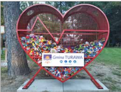
Bierzdany, obok jednostki OSP

względu na aspekt humanitarny, jak i środowiskowy, dlatego na terenie gminy sfinansowano 13 metalowych serduszek, które zostały dostarczone do wszystkich sołectw gminy Turawa oraz dwóch przysiółków Trzęsiny i Marszałki. Dzięki tym metalowym pojemnikom mieszkańcy będą mogli pomagać tym, którzy po- ➤