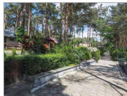
Jezioro Turawskie Duże – brzeg północny

Za siedliskami ptaków zjeżdżamy z wału tuż przed budynkiem zapory na Małej Panwi. Jedziemy wąską i wybiistą ścieżką połą biegnącą prostopadle do wału jeziora i docieramy nią do asfaltowej szosy Szczedrzyk–Jedlice. Skręcamy w lewo i po chwili mijamy hutę szkła w Jedlicach, a za nią most na Małej Panwi. Tu warto na chwilę zjechać z trasy do pobliskiego Antoniowa, gdzie na początku wioski, przy ul. Stawowej znajduje się piękny ogród kwiatny. Za mostem na Małej Panwi skręcamy w lewo, opuszczając zielony szlak rowerowy i poruszając się już do końca szlakiem czerwonym. Tuż za wioską wjeżdżamy na długi i piękny odcinek leśny, który kończy się dopiero w Dylakach. Wjeżdżamy do nich ul. Jakuba i od razu na pierwszym skrzyżowaniu skręcamy w lewo, w ul. Szymona. Na jej końcu skręcamy w prawo i jedziemy skrajem lasu do ul. Szkolnej. Tu znów skręcamy w lewo i od razu w prawo. Po chwili przejeżdżamy przez mostek na malowniczej rzeczce Libawie. Jeśli zjedziemy z trasy w lewo za mostkiem, dojedziemy do ujścia rzeczki