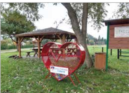
Marszałki, (przysiółek) obok placu zabaw przy ul. Sosnowej