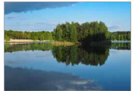
Jezioro Turawskie Średnie

funkcje wypoczynkowe i rekreacyjne. Hrabia, aby uzyskać zgodę na jego budowę, musiał spotkać się z Adolfem Hitlerem. Jezioro powstało w 1938 roku. Konieczne było zalanie dwóch wiosek, których mieszkańcy zostali przesiedleni do nowych domków w stylu pruskim w Ligocie Turawskiej i Zakrzowie Turawskim. Zbiornik ma 24 km 2 powierzchni i 13 m głębokości. Nad całym kompleksem Jezior Turawskich znaleźć można liczne plaże, ośrodki wypoczynkowe, hotele, punkty gastronomiczne, przystanie żeglarskie, wypożyczalnię sprzętu wodnego i wiele innych atrakcji.