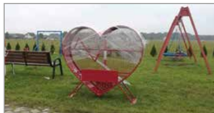
Ligota Turawska, obok placu „Pod Bocianim gniazdem”