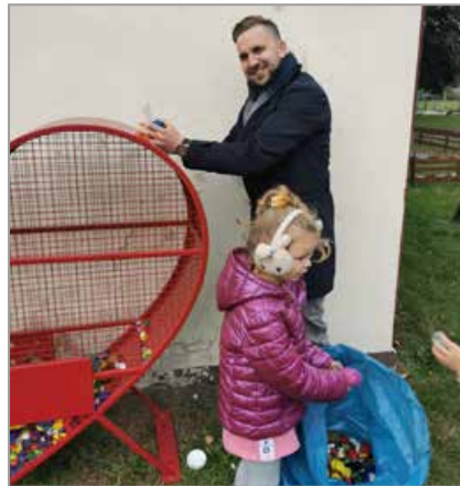
Kotórz Wielki, obok Klubu pod Lipą