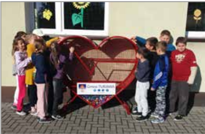
Kadłub Turawski, obok szkoły podstawowej przy ul. Głównej