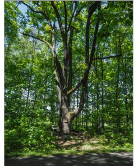
Turawa – dąb Klemens, pomnik przyrody

Piękny dąb często pomijany przez turystów odwiedzających Turawę. Stoi przy drodze pomiędzy Turawą a promenadą spacerową nad jeziorem, po jej lewej stronie.