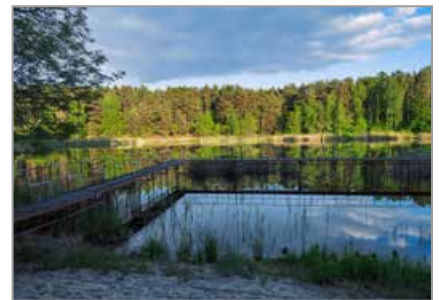
Jezioro Turawskie Małe

funkcje wypoczynkowe i rekreacyjne. Hrabia, aby uzyskać zgodę na jego budowę, musiał spotkać się z Adolfem Hitlerem. Jezioro powstało w 1938 roku. Konieczne było zalanie dwóch wiosek, których mieszkańcy zostali przesiedleni do nowych domków w stylu pruskim w Ligocie Turawskiej i Zakrzowie Turawskim. Zbiornik ma 24 km 2 powierzchni i 13 m głębokości. Nad całym kompleksem Jezior Turawskich znaleźć można liczne plaże, ośrodki wypoczynkowe, hotele, punkty gastronomiczne, przystanie żeglarskie, wypożyczalnię sprzętu wodnego i wiele innych atrakcji.