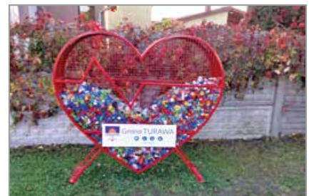
Węgry, na Zielonym Skwerku w centrum wsi