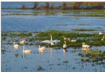
Ptaki – łabędzie (Turawa)

Położone są przy południowym brzegu Jeziora Turawskiego pomiędzy Szczedrzykiem a Jedlicami. Pośród zarośli i zatopionych drzew można spotkać liczne łabędzie, kaczki, kormorany czy gęsi. Szczególny ruch panuje tu wiosną i jesienią, kiedy nad jeziorami przelatują liczne ptaki wędrownie. Czasem na wiosnę można tu również zaobserwować tarło karpia.