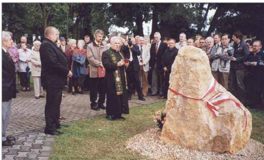
Uroczyste odsłonięcie obelisku z inskrypcją