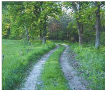
Czerwony szlak rowerowy Jedlice – Dylaki

Położona jest przy południowo-wschodnim brzegu Jeziora Turawskiego, niedaleko zapory na Małej Panwi w Jedlicach. Prowadzi do niej leśna droga odbijająca w lewo od czerwonego szlaku rowerowego. Rozpościera się z niej piękny widok na całe jezioro. Ze względu na duże nasłonecznienie to dobry teren dla miłośników kąpeli słonecznych.