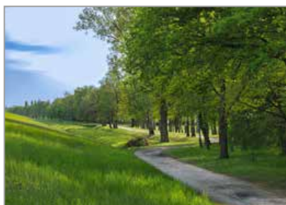
Jezioro Turawskie Duże – brzeg zachodni

Choć kojarzone są z największym z jezior, w rzeczywistości są to aż cztery różne akwenty – Jezioro Turawskie Duże, Jezioro Średnie, Jezioro Małe i nieco oddalone Jezioro Srebrne. Największy zbiornik powstał w latach 30. XX wieku na dobrach hrabiego Hubertusa. Sztuczny zbiornik na Małej Panwi miał chronić Opole przed powodzią, ale także pełnić