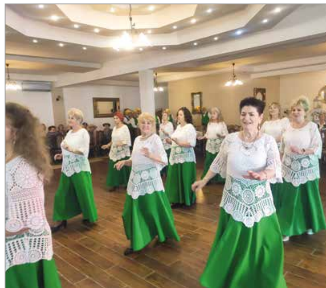
Grupa „Złoty liść” z Domu Seniora Złota Jesień