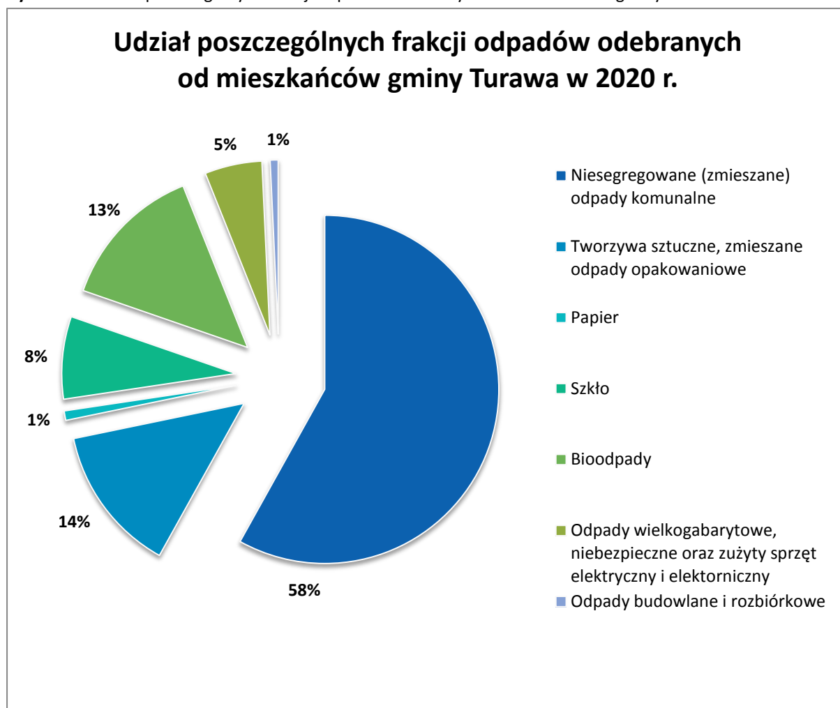
Rysunek 1. Udział poszczególnych frakcji odpadów odebranych od mieszkańców gminy Turawa w 2020 r.

Zgodnie z powyższym wykresem zaobserwowano znaczną przewagę niesegregowanych (zmieszanych) odpadów komunalnych nad poszczególnymi frakcjami segregowanych odpadów komunalnych. Niesegregowane (zmieszane) odpady komunalne stanowią aż 58% wszystkich odpadów odebranych od mieszkańców gminy w roku 2020, natomiast odpady segregowane stanowią 42%. Największą część spośród odpadów selektywnie zebranych stanowią tworzywa sztuczne, zmieszane odpady opakowaniowe – 14%, a następnie biodpady - 13% całości odebranych odpadów.