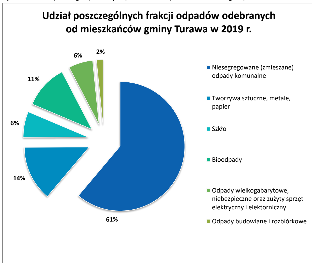
Rysunek 2. Udział poszczególnych frakcji odpadów odebranych od mieszkańców gminy Turawa w 2019 r.

Zgodnie z powyższym wykresem zaobserwowano znaczną przewagę niesegregowanych (zmieszanych) odpadów komunalnych nad poszczególnymi frakcjami segregowanych odpadów komunalnych. Niesegregowane (zmieszane) odpady komunalne stanowią aż 61% wszystkich odpadów odebranych od mieszkańców gminy w roku 2019, natomiast odpady segregowane stanowią 39%. Największą część spośród odpadów selektywnie zebranych stanowią tworzywa sztuczne, metale i papier – 14%, a następnie biodopady - 11% całości odebranych odpadów.